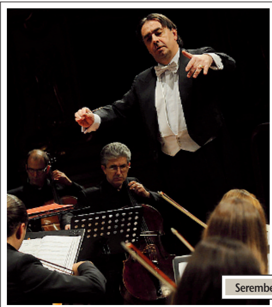
Serembe ha diretto le orchestre del Marenzio e da Camera di Brescia

Riuscito sotto tutti i profili il concerto sinfonico a sostegno dell'impegno della Croce Rossa per i bambini di Haiti