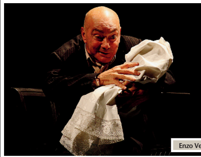
Enzo Vetrano in «Pensaci, Giacomino!» di Pirandello